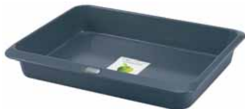
BW0000044 Pekáč 52,0 x 38,0 x 6,0 cm