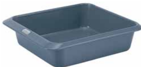
BW0000042 Zapékací mísa na lasagne 28,0 x 22,0 x 7,5 cm