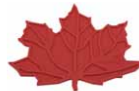
Podložka pod hrnec – javorový list