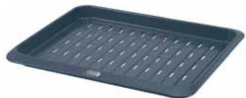
BW0000045 Grilovací plech do trouby 28,0 x 38,0 x 2,5 cm