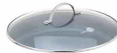
CW0001005 Ø 24,0 cm CW0001704 Ø 26,0 cm CW0001006 Ø 28,0 cm CW0001705 Ø 30,0 cm