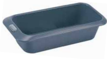
BW0000043 Forma na biskupský chlebíček 28,0 x 7,5 x 7,5 cm