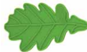
Podložka pod hrnec – dubový list