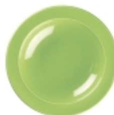
Talíř polévkový pr. 22,0 cm