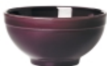
Miska na cereálie pr. 14,5 cm