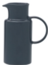
Džbán 1,0 l