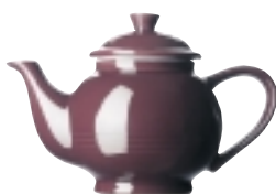
Konvice čajová 1,0 l