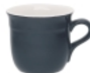
Hrnek 0,27 l