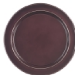
Talíř jídelní pr. 28,0 cm