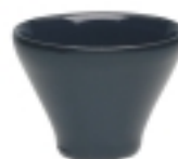
Šálek na espresso pr. 7,0 cm