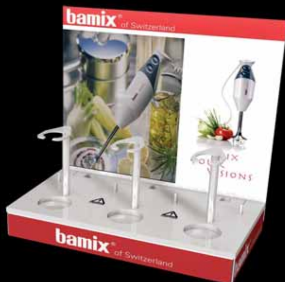
795.020 Display 36 x 20,5 x 41,5 cm akrylát